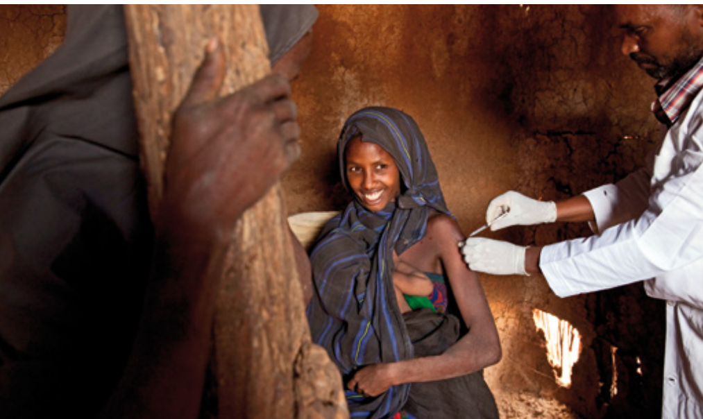
Ethiopie 2013

La Campagne Sourires de mères africaines a deux ans. Il est difficile de faire un bilan et comme toujours, la tentation est de s'en remettre entièrement aux chiffres, au nombre de femmes assistées pendant leur grossesse (52.863) et leur accouchement (11.438) et au nombre d'enfants vaccinés (250.000), visités et soignés (plus de 190.000), aux personnes atteintes par la communication de notre campagne. « Les grands aiment les chiffres et tout mesurer » disait Saint-Exupéry (les grands sont les adultes pour les quelques personnes qui n'ont pas lu le Petit Prince) et en restant encore fidèle au fait d'être adulte nous pouvons dire avec satisfaction que, malgré le contexte tout autre que facile, nous sommes en ligne avec les prévisions d'il y a environ deux ans. Toutefois, les chiffres sont aveugles et risquent de cacher le processus situé derrière eux, les difficultés, le travail et la recherche obligatoires pour atteindre ces résultats. Notre campagne donc notre travail - dont - Sourires de mères africaines est un « habit » pour se présenter et se faire comprendre - n'est pas fait de chiffres mais d'histoires qui relient les personnes et de mondes qui se rencontrent. Pour chacun de ces mondes, ce serait la peine de faire un bilan à part. Nous allons donc voir ce bilan - sans chiffres - de quelques-unes de ces rencontres.