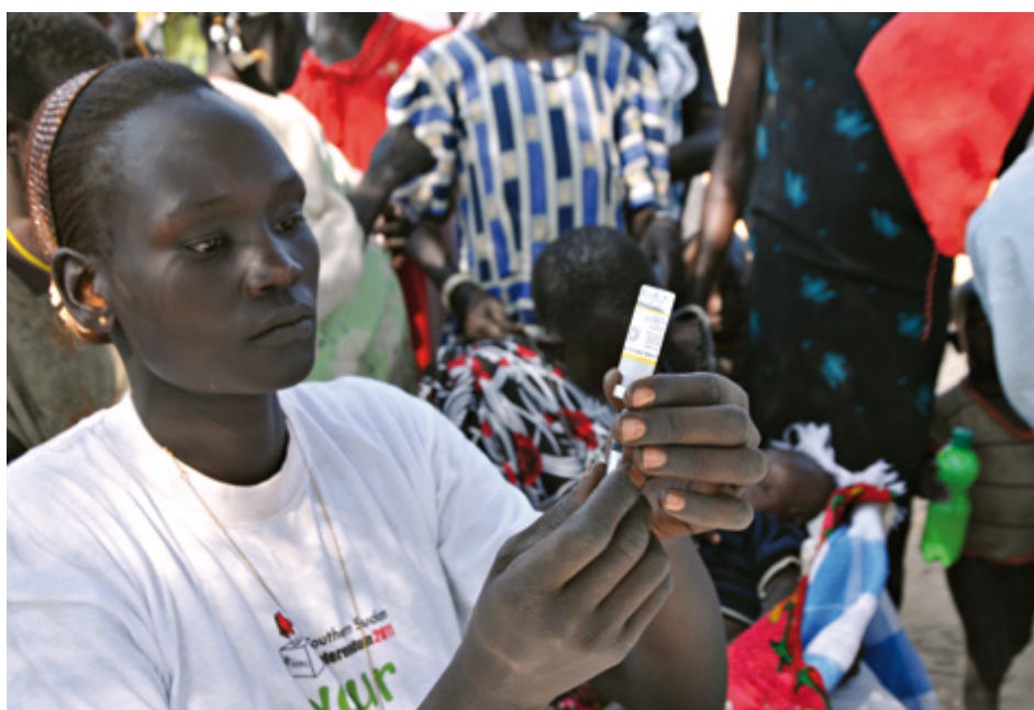
Soudan du Sud 2012

Nous avons introduit récemment des services de prévention de malnutrition dans 2 des 5 comtés dans lesquels nous travaillons et nous comptons étendre