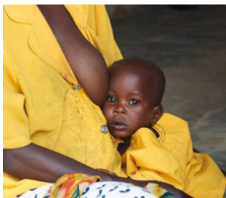
Archive CCM, Burundi 2013

Etre maman au Burundi peut se décrire avec les froides statistiques de l'OMS : mariage en bas âge, une moyenne de six enfants, durée de la vie une cinquantaine d'années, etc...etc..